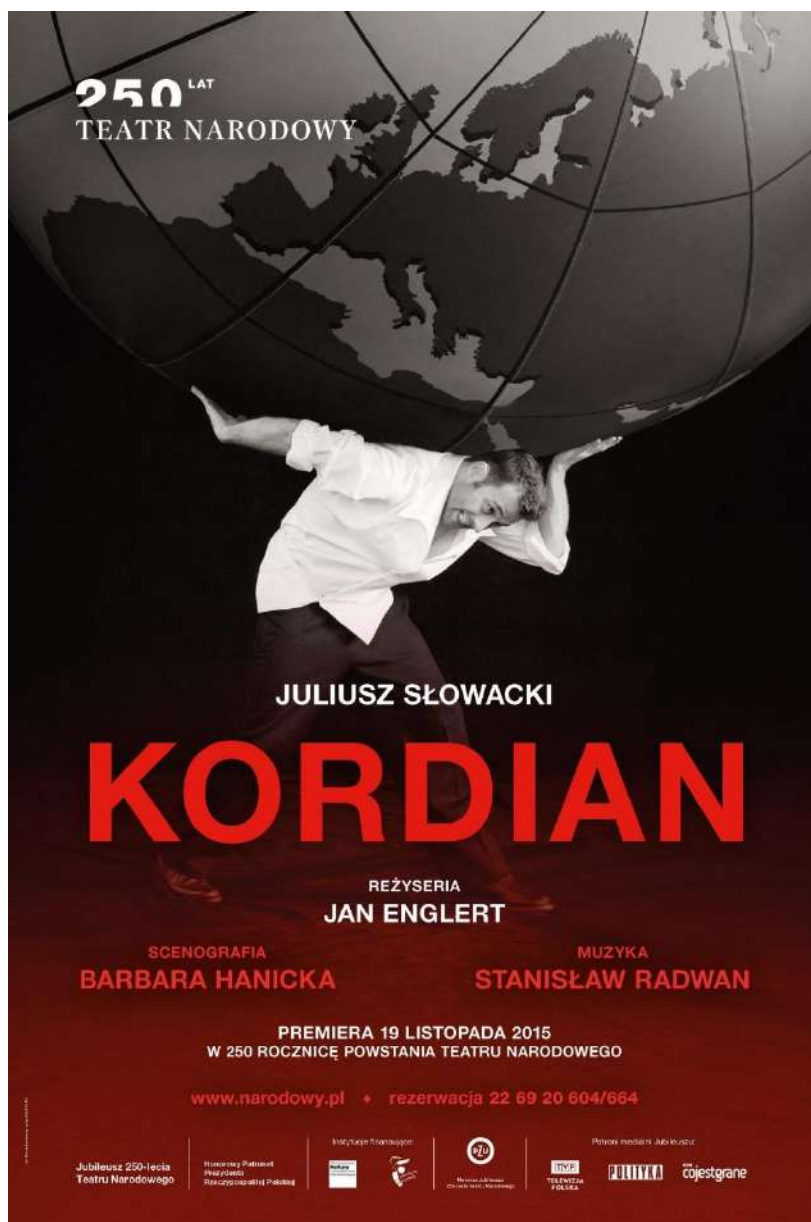
Plakat do przedstawienia Kordian – fot. Maciej Landsberg, projekt: Elipsy, Archiwum Artystyczne Teatru Narodowego, www.narodowy.pl

Zapoznaj się z plakatem do przedstawienia Kordian według dramatu Juliusza Słowackiego.