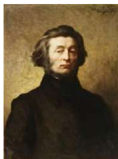
Adam Mickiewicz (1798–1855) – jeden z najwybitniejszych poetów polskich, działacz polityczny, publicysta.

– Twe miłosierdzie, Panie, jest bez granic.