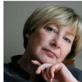
Ewa Lipska (ur. w 1945 r.) – poetka i felietonistka.

Mogę być sobą i sterować nocą by się w nietrwale nie zapuszczać lądy i pustej doby nie trzymać w ramionach. Myśli powtarzać by zostały po nas znowu dla kogoś. Dla tych samych odkryć.