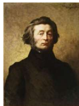
Adam Mickiewicz (1798–1855) – jeden z najwybitniejszych poetów polskich, działacz polityczny, publicysta.

„A co? – krzyknął Asesor, kręcąc strzelby rurą – A co, fuzyjka moja? Górą nasi, górą! A co, fuzyjka moja? Niewielka ptaszyna, A jak się popisała? To jej nie nowina.