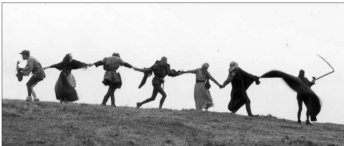
Kadr z filmu Siódma pieczęć, reż. Ingmar Bergman, 1957

Zapoznaj się z poniższym kadrem z filmu Siódma pieczęć w reżyserii Ingmara Bergmana.