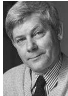
Zbigniew Herbert (1924–1998) – poeta, eseista, dramaturg.

Zbigniew Herbert, Pan Cogito a ruch myśli , [w:] tegoż, Pan Cogito , Warszawa 1974.