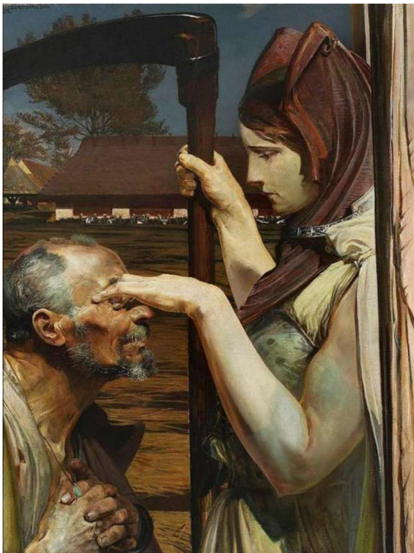
Jacek Malczewski, Śmierć , 1902, Muzeum Narodowe w Warszawie