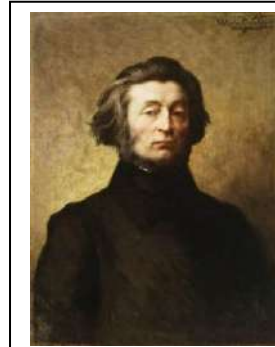
Adam Mickiewicz (1798–1855) – jeden z najwybitniejszych poetów polskich, działacz polityczny, publicysta.

Moskwa mnie uważała gwałtem za stronnika, Dano Soplicom znaczną część dóbr nieboszczyka, Targowiczanie potem chcieli mnie zaszczyścić Urzędem. Gdybym wtenczas chciał się przemoskwicić!