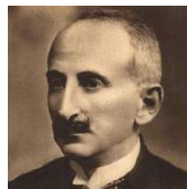
Bolesław Leśmian (1877–1937) – poeta, prozaik, eseista, krytyk literacki, czołowy przedstawiciel literatury dwudziestolecia międzywojennego.

Kroki moje już dudnią po grobli – nad rzeką. Słysząc je tak daleko! Tak cudnie daleko! A teraz – bieg z powrotem do domu – przez trawę – I po schodach, co lubią biegnących stóp wrzawę... I pokój, przepelniony wiosną i upałem, I tym moim po kątach rozwłóczonym ciałem – Dotyk szyby – ustami... Podróż – w nic, w oszklenie – I to czujne, bezbrzeżne z całych sił – istnienie!