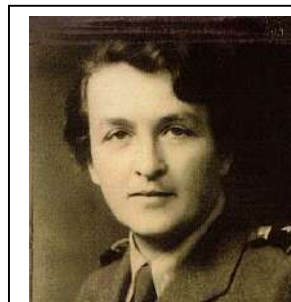
Beata Obertyńska (1898–1980) – poetka i pisarka.

Beata Obertyńska, Strych , [w:] tejże, Tarta róża , Warszawa 2017.